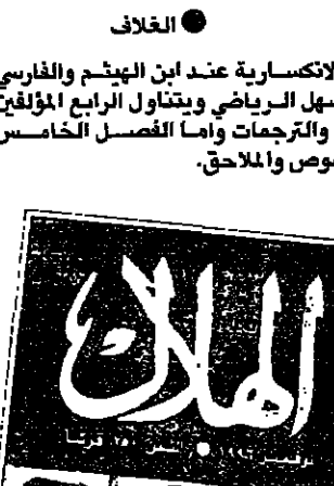
علم الهندسة والناظر

وبدأ علم الانكسارية عند ابن الهيثم والفارسي والثالث ابن سهل الرياضي ويتناول الرابع المؤلفين والنصوص والترجمات واما الفصل الخامس فيتناول النصوص والملاحق.